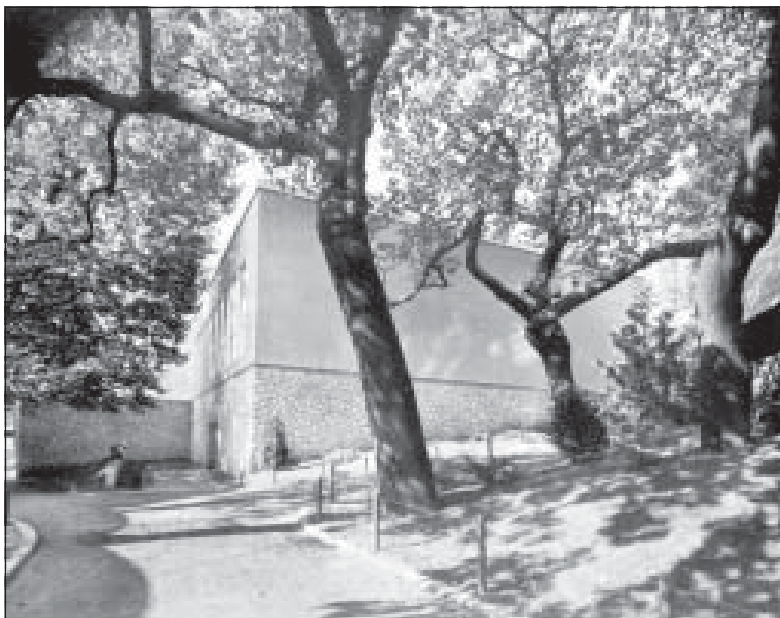
Сл. 3. Josip Sajsl, Југословенски павиљон на Светској изложби у Паризу 1937, бочни изглед.

J. Seissel, Jugoslavenski paviljon na Međunarodnoj izložbi u Parizu, Zagreb 1937 , n. p.