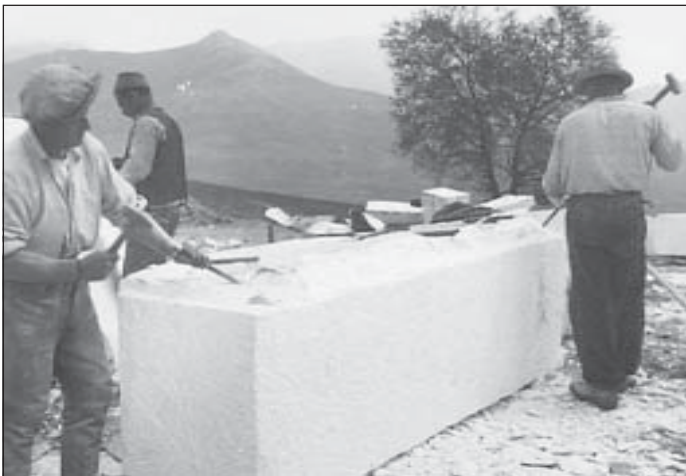
Сл. 4, 5. Каменолом „Набрегово“ крај Прилепа Јарослава Штрехе, фотографије вађења мермера, 1937.

АСЦГ, 65 (Министарство трговине и индустрије Краљевине Југославије), Ф275, 833.