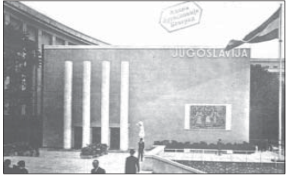
Сл. 2. и сл. 2а. Јосип Сајсл, Југословенски павиљон на Светској изложби у Паризу 1937.

АСЦГ, 65 (Министарство трговине и индустрије Краљевине Југославије), Ф275, 833.