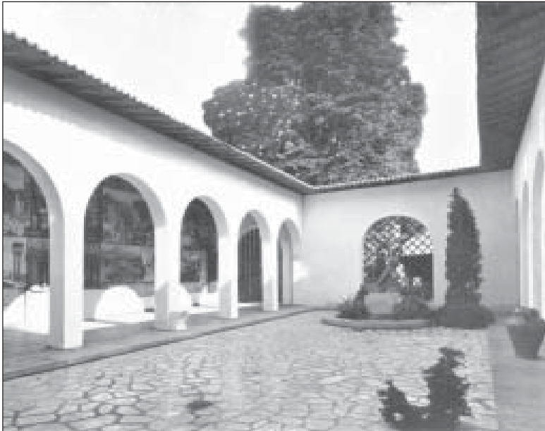
Сл. 7. Јосип Сајсл, Југословенски павиљон на Светској изложби у Паризу 1937, Регионално двориште.

као [индустријски] шед-кров 448 – писао је пројектант павиљона Сајсл. Такав просторни и визуелни поредак речито је говорио о Југославији јединством модерности и аутентичне народне културе.