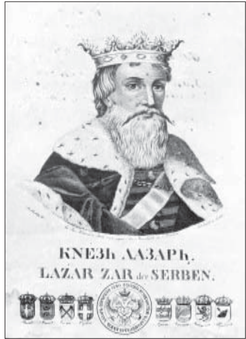
С. Ленхар, Кнез Лазар , 1828.