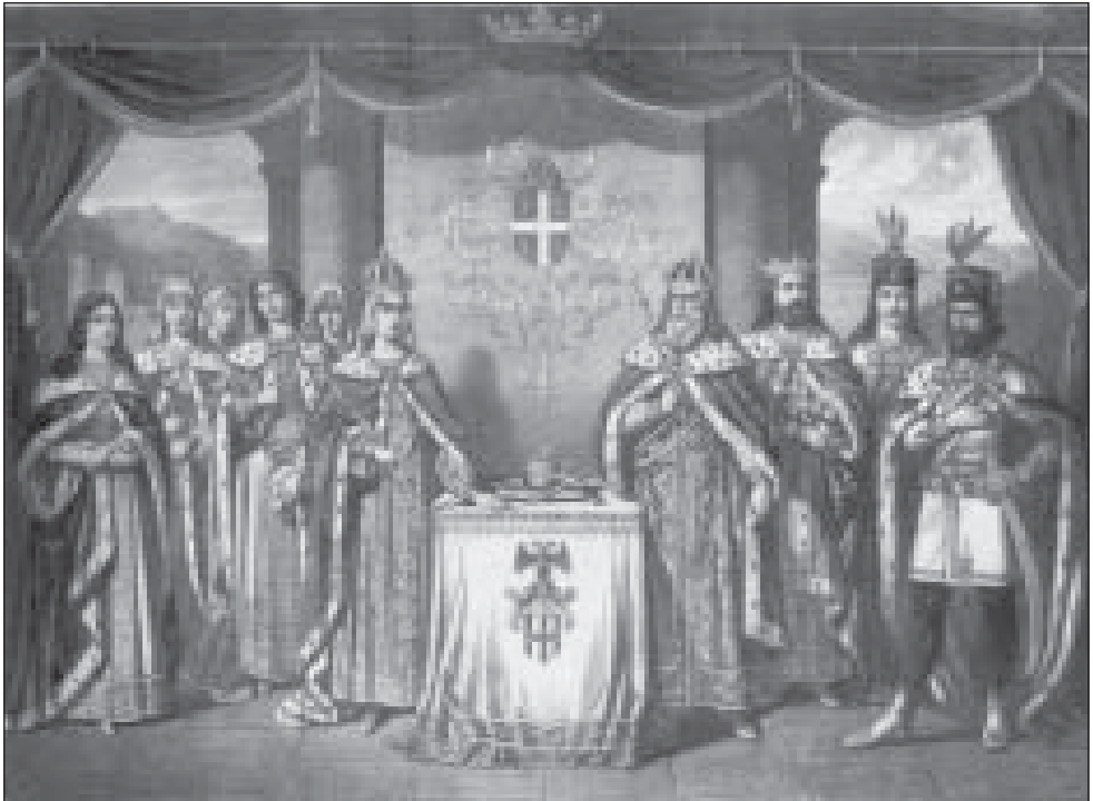
А. Стефановић, Цар Лазар и његова породица , 1870.

У оквиру визуелног уобличавања приватног живота значајно место традиционално су имали објекти повезани са религиозним обредима попут икона, кућних олтара, религиозних слика и скулптура. Национализам је изменио и преобликовао визуелно уобличавање приватног живота. Снага национализма, која, по многим обележјима, има одлике вере, „профане религије“, увела је у приватни амбијент националне култне слике и објекте. Уместо икона светитеља, појављују се ликови националних хероја или се, пак, светитељима аплицирају национална обележја. Сlike националне историје заузимају кућне просторе. Јавља се поштовање према објектима који симболизују национални идентитет. Дефинисање националног у приватном простору била је потреба и обавеза свих припадника нације. То је условило да се уметничка индустрија укључи у продукцију националне визуелне културе, па су литографије и олиографије хероја нације и догађаја из националне историје постале један од основних елемената у визуелном истицању националног у приватном животу. Серијска производња националних „икона“ условила је јединствено обележавање приватног простора припадника нације. Тиме је ширен истоветни вид визуелне поруке, који је потхрањивао и едуковао национална осећања.