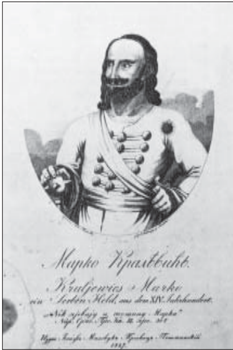
С. Ленхард, Марко Краљевић , 1827.