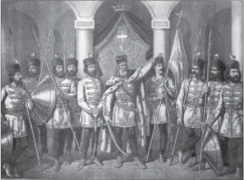
А. Стефановић, Југ Богдан и његови синови , 1870.

Пример сликања историјских композиција у приватном простору очуван је у Врању. После припајања тог града Србији, на таваници приватне куће настала је композиција која представља почетак другог српског устанка под кнезом Милошем Обреновићем 1815. године, „Таковски устанак“. 58 Како је Врање, као и читав простор јужне Србије, представљао територију српско-бугарских националних сукоба, та композиција, уз продинастичке садржаје, јасно је носила и елементе националног самоодређења.