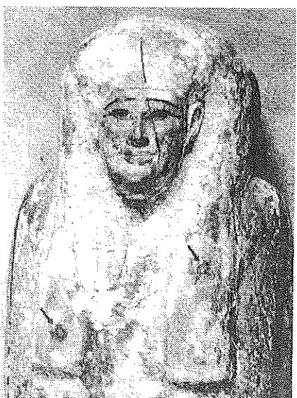
Слика 4. Горњи део ковчежа са печатима