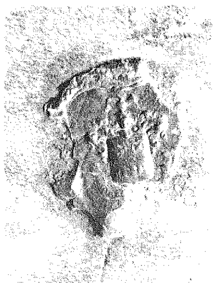
Слика 2. Десни печат на ковчежу мумије