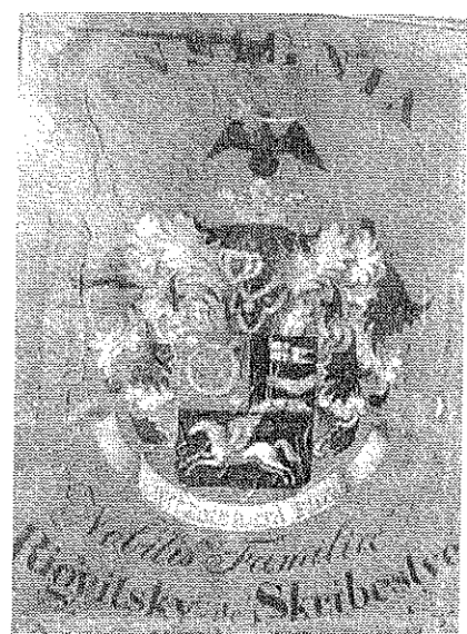
Слика 5. Грб породице Риђици