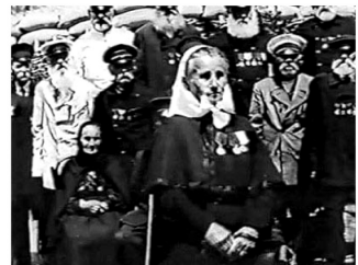
Кадрови из првог руског дугометражног играног филма Одбрана Севастопоља (1911)

Репертоар руске царске филмске сцене представља обиман каталог очуваних руских играних филмова од 1908. до 1919. године, који су В. Иванова, В. Миљникова и С. Сковородникова припремили и објавили за издавачку кућу Нови литературни приказ . То луксузно издање већег формата садржи бројне сцене из филмова и фотографије глумца и режисера. У каталогу је описано више од триста филмова, који су у целини или у деловима сачувани у филмским архивским колекцијама широм света: Госфилмофонд Русије, Руски државни