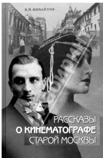
В. Михайлов, Рассказы о кинематографе старой Москвы , Москва, 2003.