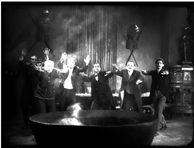
Слика бр. 1.

Хрватске могли бити, на неки начин, сузбијени? Свакако, репресивни апарат је тада био у најбољој кондицији. Али, поред голе силе, потребна је била и политичка воља врха савезне државе и сарадња републичких власти, а тога није било.