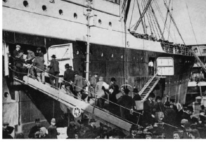
EMIGRANTS, AMERICA, AND THE STATE SINCE THE LATE NINETEENTH CENTURY